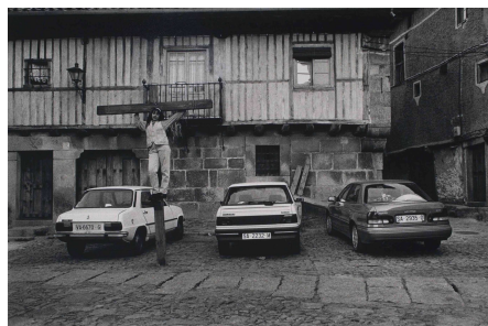
Fuentesaúco (1995) (6.373 inbentario zenbakia) eta La Alberca (1995) (6.374 inbentario zenbakia).

Web honetan jaso dezakezu informazioa www.museodenavarra.navarra.es